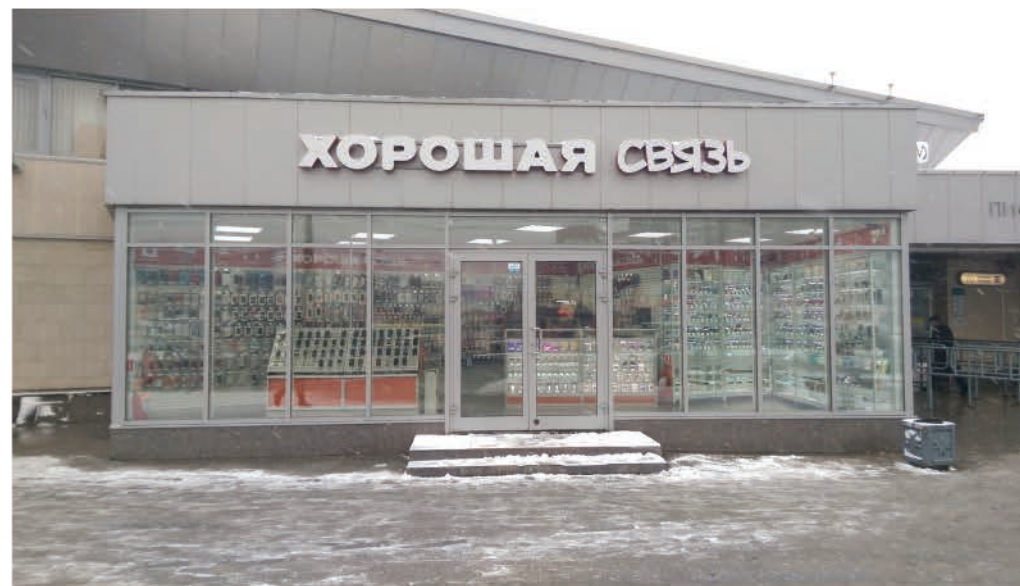
ст. метро "Пионерская", Санкт-Петербург