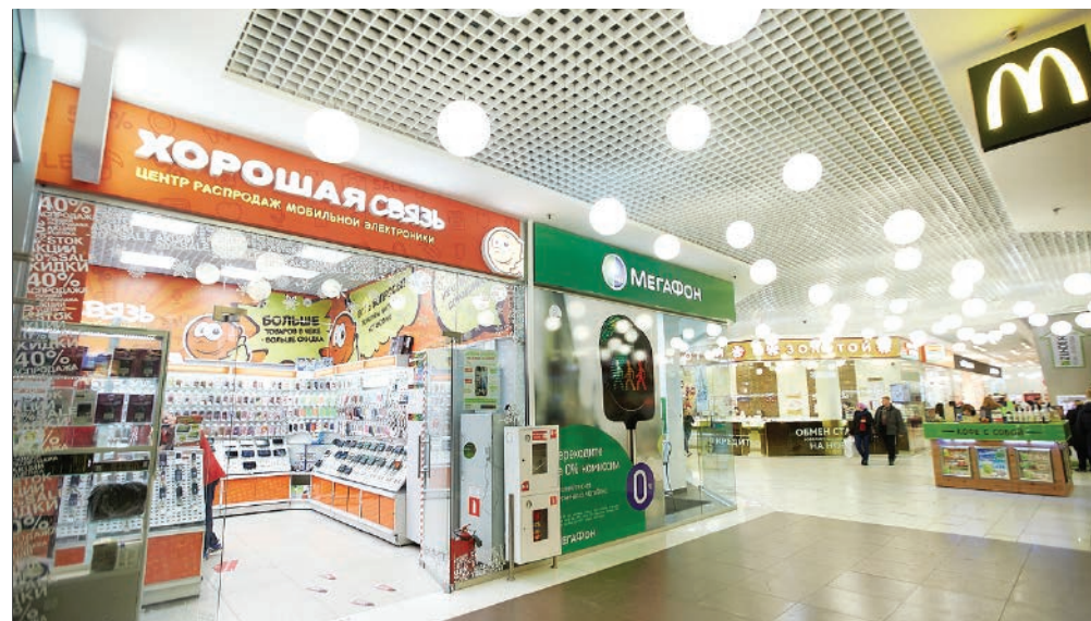
ТРЦ "Макси", Петрозаводск