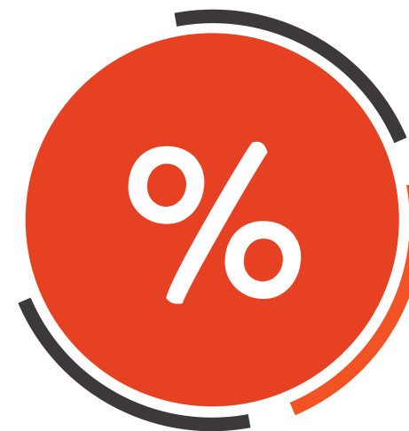
ОПТОВАЯ - ТОРГОВЛЯ