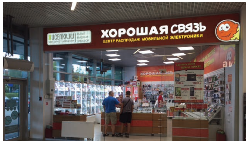
ТРЦ "Макси", Смоленск