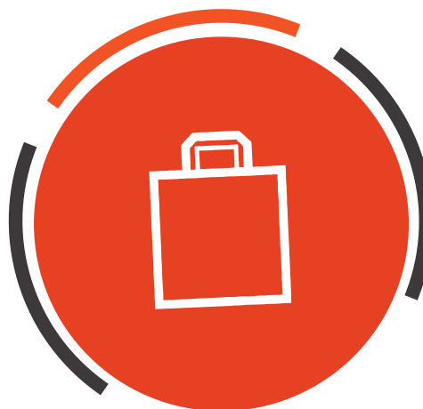
ИНТЕРНЕТ - МАГАЗИН