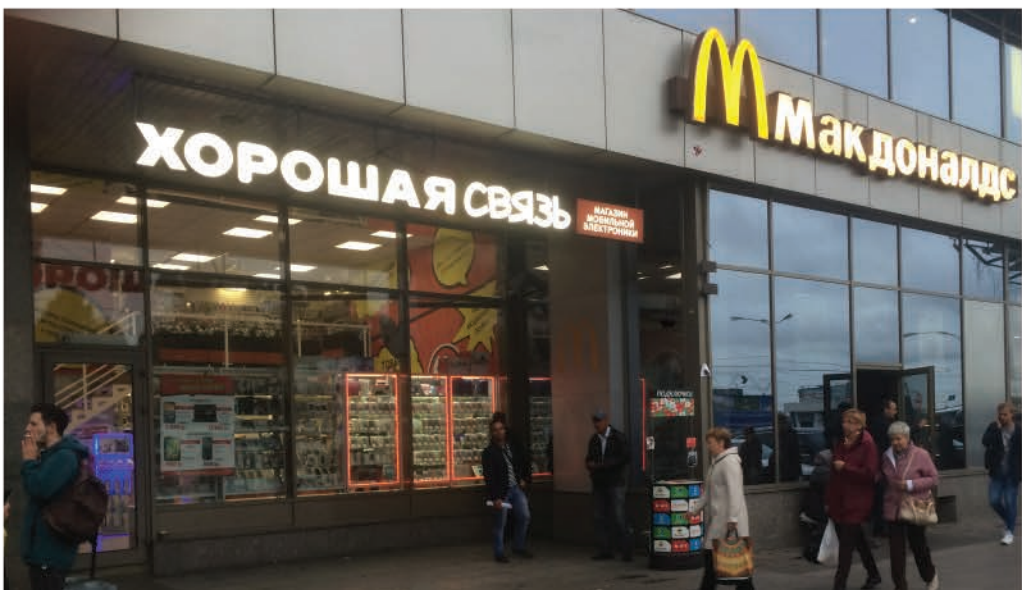
ст. метро "Площадь Александра Невского", Санкт-Петербург