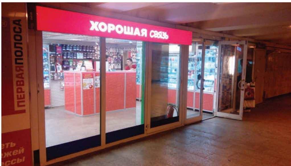
ст. метро "Московская", Санкт-Петербург