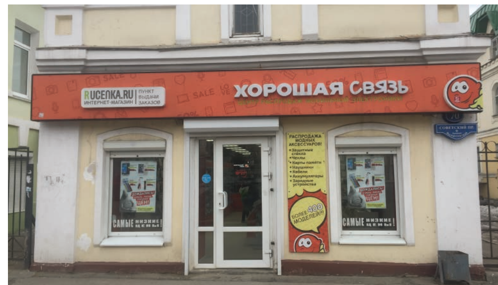
пр. Советский 70, Череповец