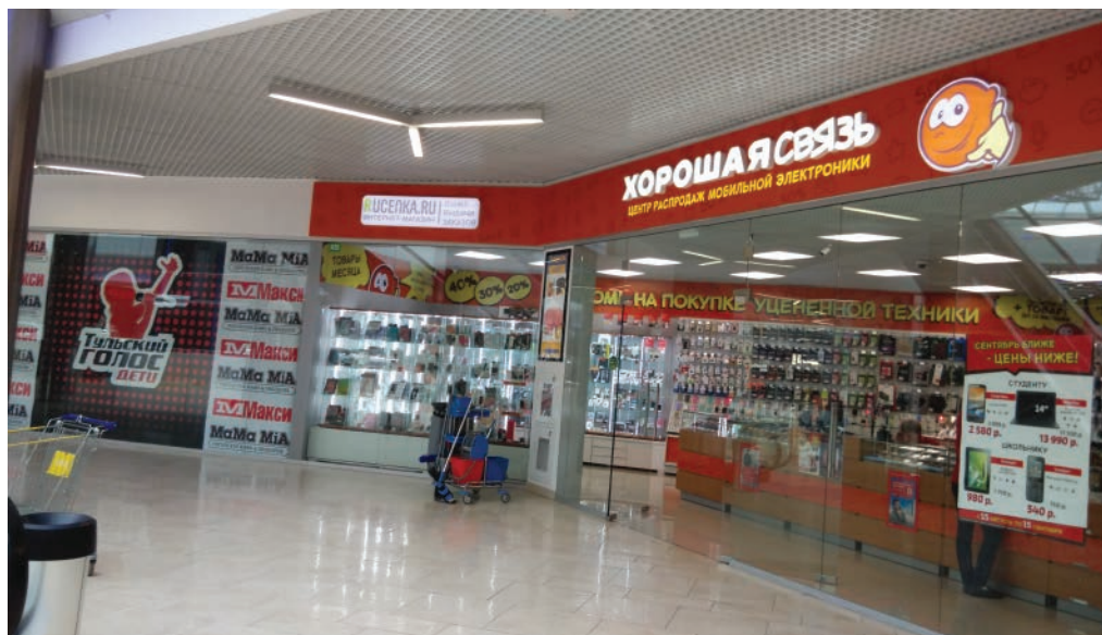
ТРЦ "Макси", Тула