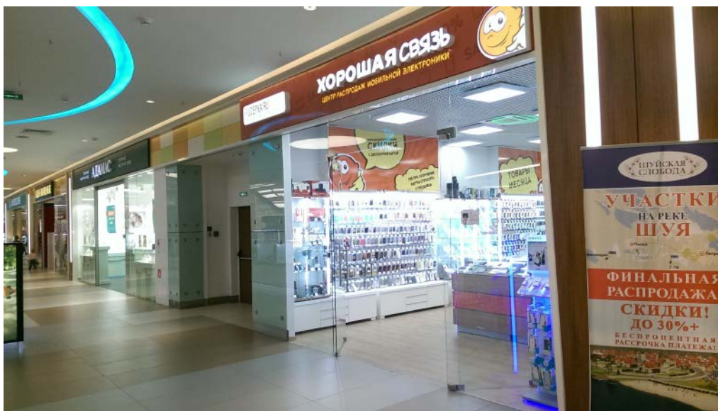
ТРЦ "Лотос-Plaza", Петрозаводск