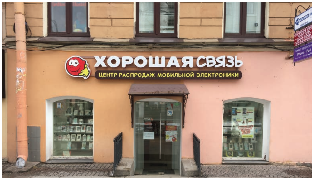
ст. метро "Василеостровская", Санкт-Петербург