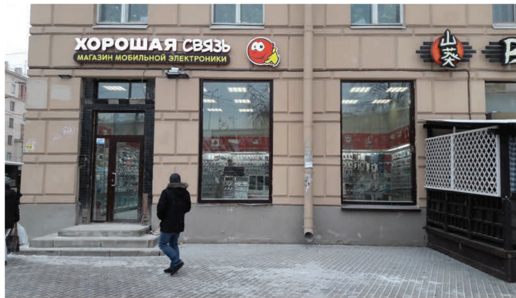
ст. метро "Новочеркасская", Санкт-Петербург