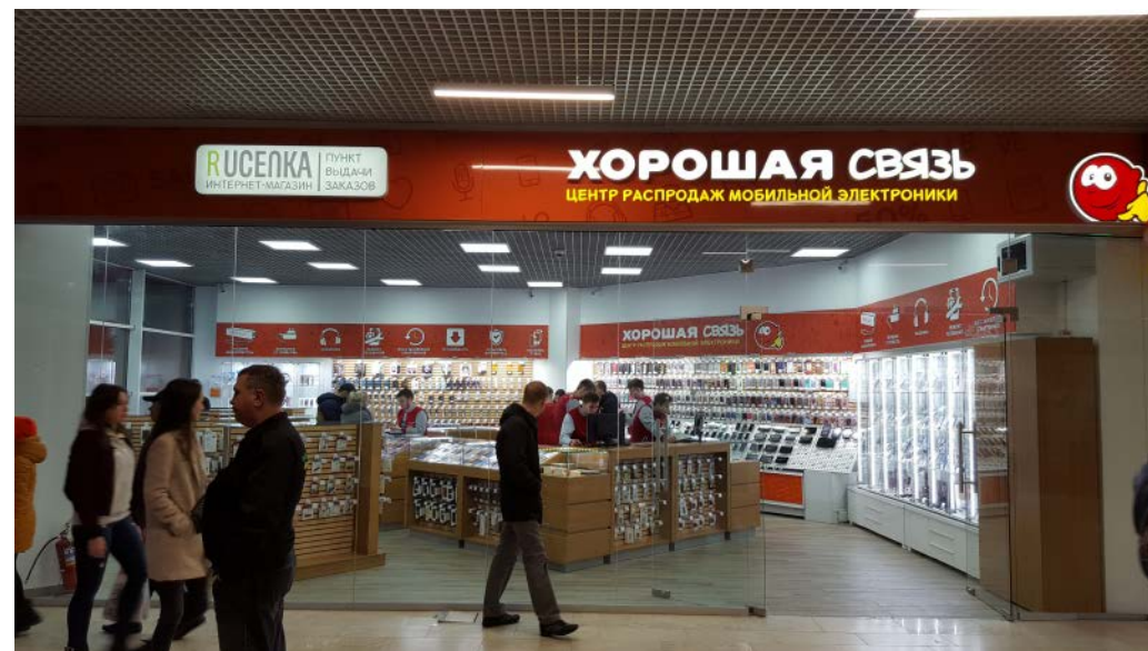
ТРЦ "Макси", Архангельск