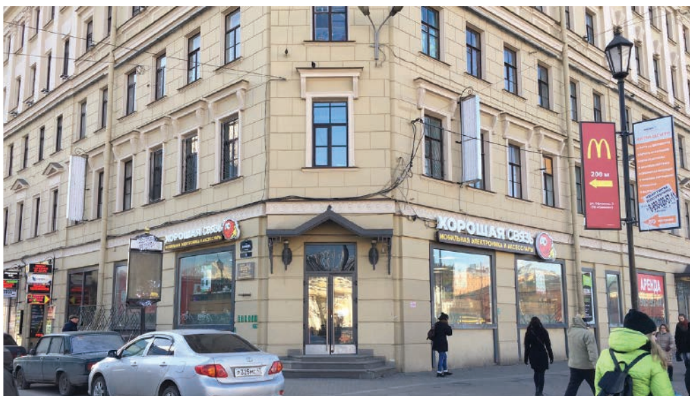
ст. метро "Сенная", Санкт-Петербург